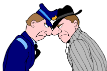
El policía El delincuente

Encierra en un círculo el que ha pecado.