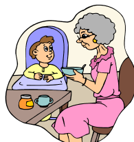
El hermano menor La abuelita