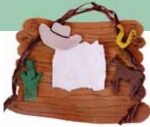
Rótulo en la Pared